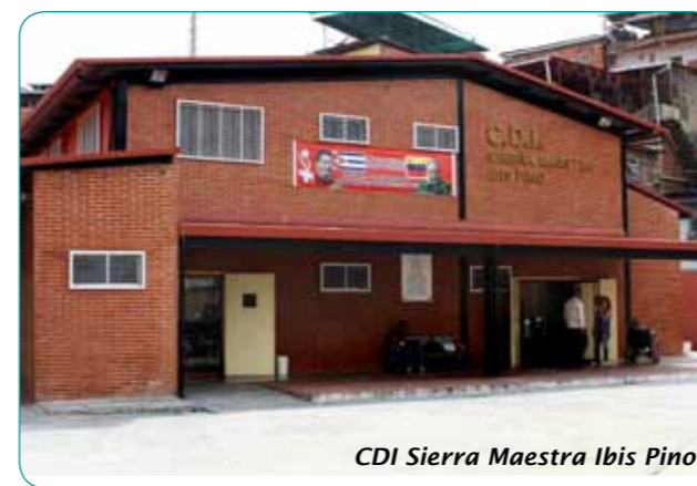
CDI Sierra Maestra Ibis Pino