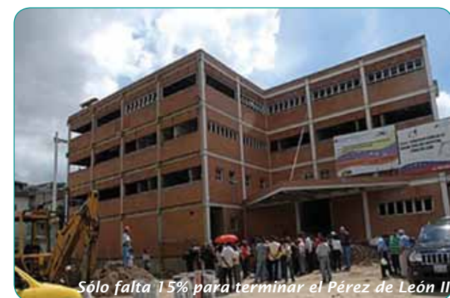
Sólo falta 15% para terminar el Pérez de León II

4.800 millones de bolívares serán distribuidos para mejorar la infraestructura hospitalaria nacional